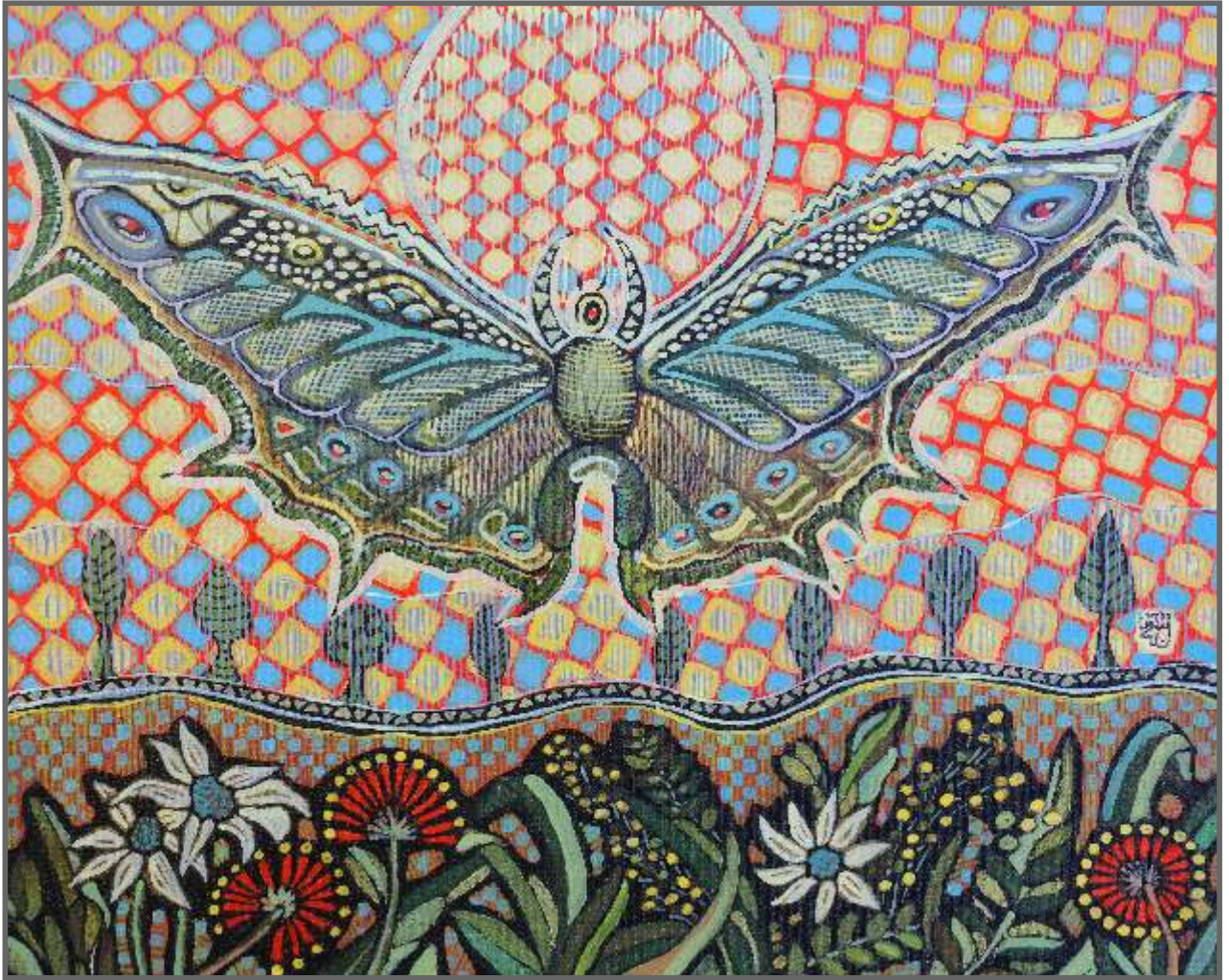
MOTYL, akryl, 40 x 50 cm