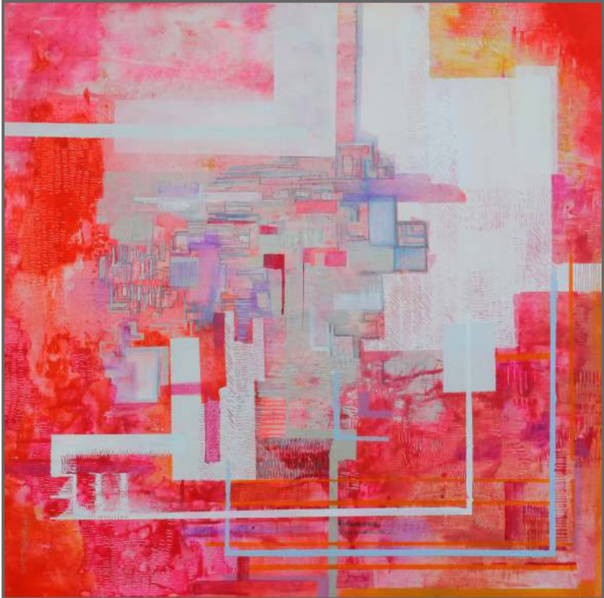
z cyklu: STRUKTURY - I, akryl, 60 x 60 cm

JOANNA BANEK KRAKÓW joanna.banek@gmail.com