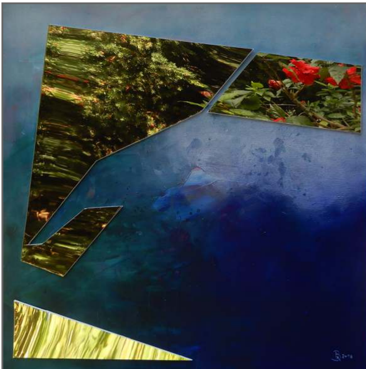
JEZIORO TARNOBRZESKIE W OTOCZENIU ARBORETUM - II technika własna, mieszana, 60 x 60 cm