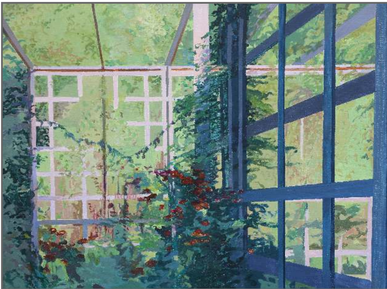
PERGOLA, akryl, 60 x 80 cm