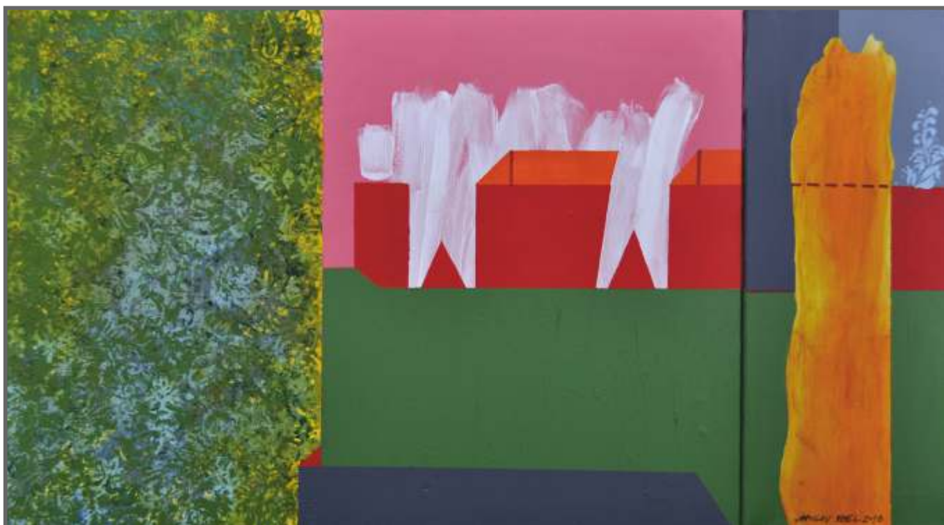
JEDEN MIŁY DZIEŃ W ARBORETUM, technika mieszana, 50 x 90 cm