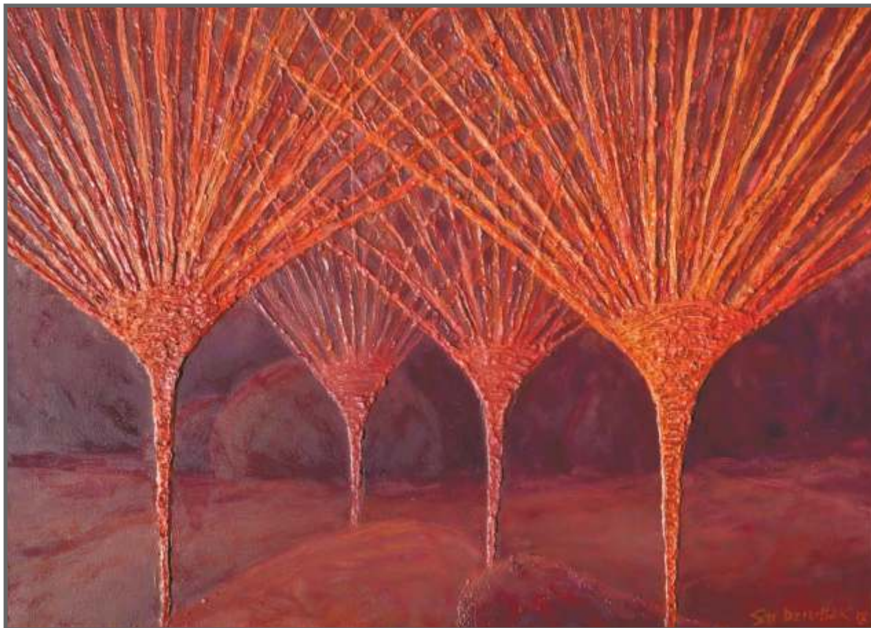
ANEMOCHORIA, technika własna, 50 x 70 cm