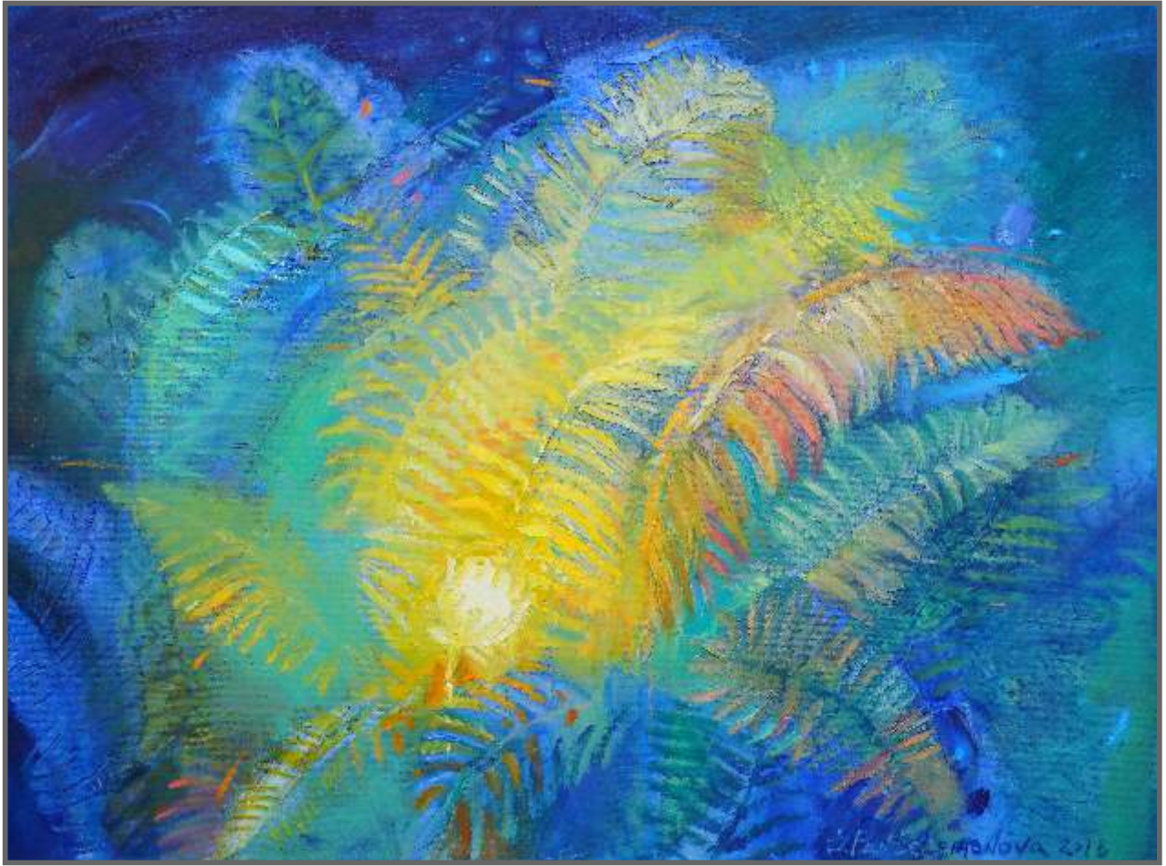
KWIAT PAPROCI, olej, 60 x 80 cm