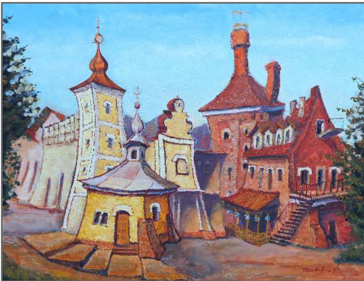
STARY BROWAR , olej, akryl, 60 x 80 cm