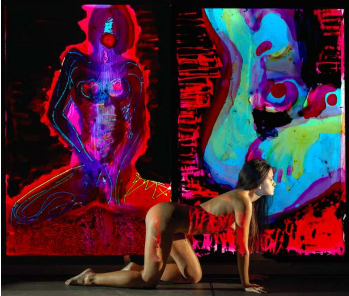
DWA CIAŁA, BŁĘKITNE I CZERWONE, grafika cyfrowa, druk pigmentowy, 70 x 83 cm