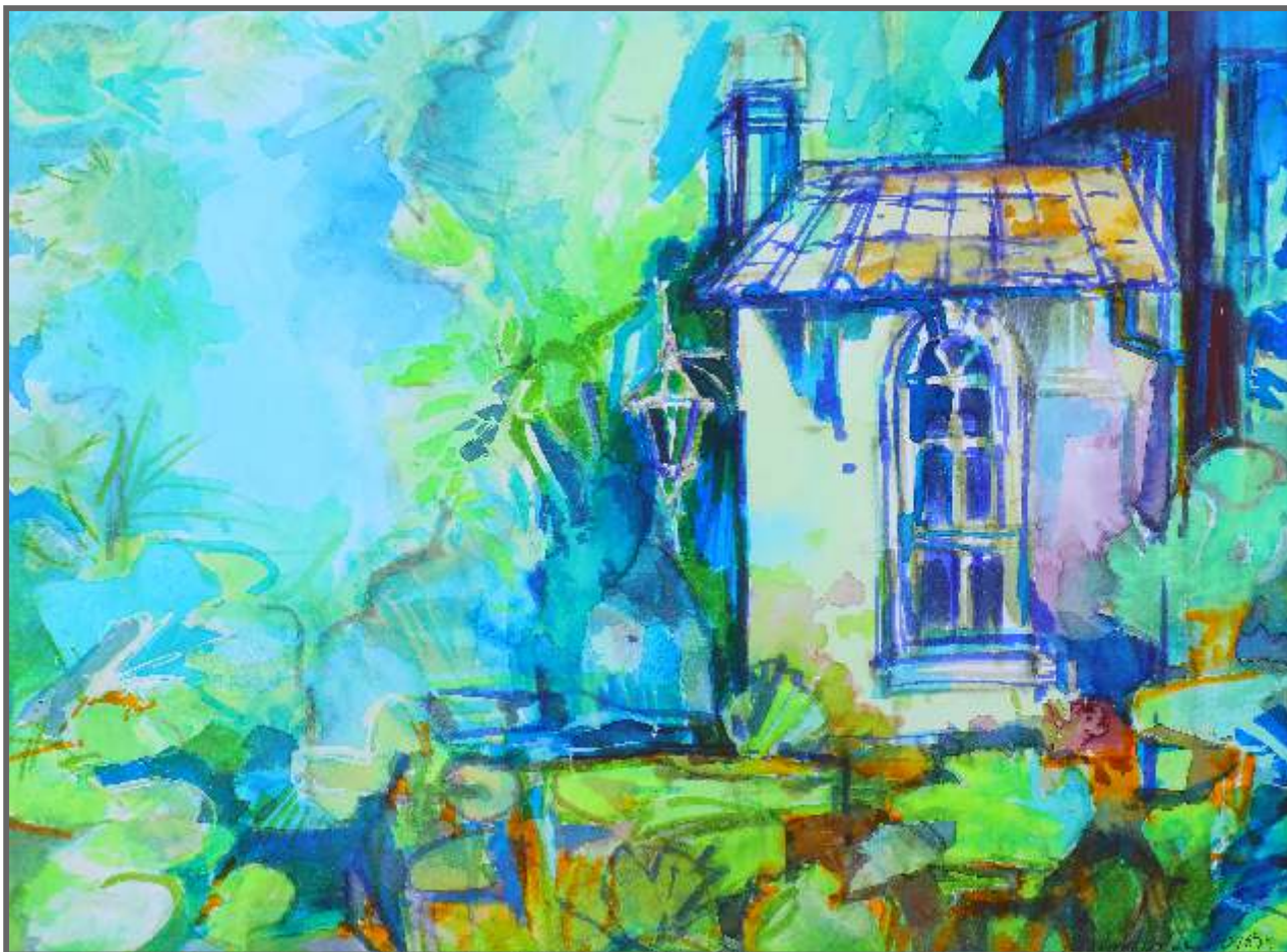
PAŁAC, akwarela, 30 x 40 cm