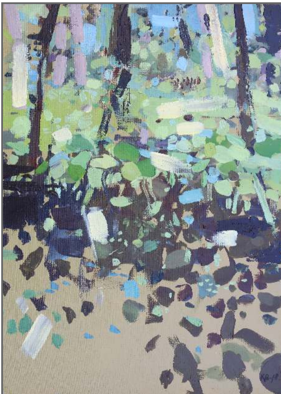
ALEJKA, akryl, 70 x 50 cm